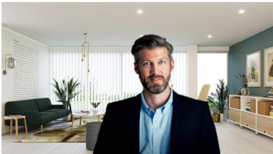
Abbildung 1: Eine Führungsperson in einer Videokonferenz, die einen Hintergrundeffekt benutzt

In Videokonferenzen können Sitzungsteilnehmende sich und ihre Hintergründe nicht verstecken. Bei der Videoübertragung muss alles stimmen, von der Kleidung über die Haare bis zum passenden Hintergrund. Unterstützend können dazu Hintergrundeffekte eingesetzt werden. Da es sich hierbei um ein neues und aktuelles Thema handelt, soll in dieser Bachelor-Thesis untersucht werden, inwiefern der Hintergrund einen Einfluss auf die Wahrnehmung der Führungsperson hat.