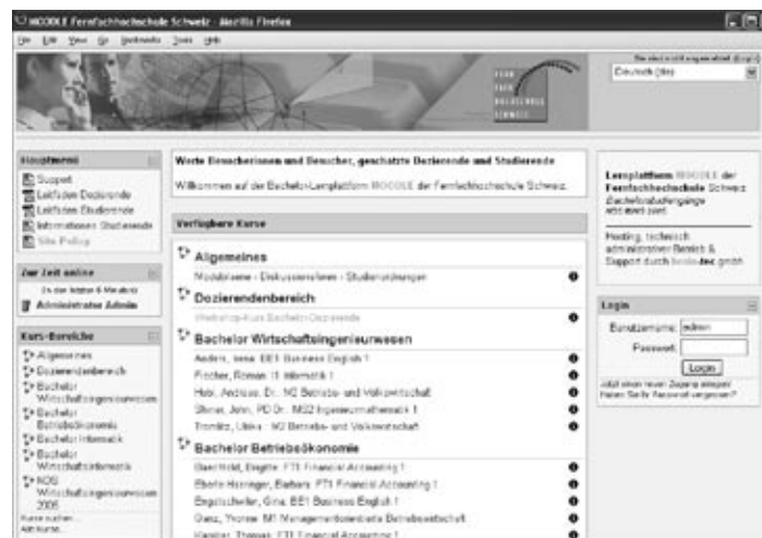
Auf der Lernplattform findet man weitere Informationen zum Supportsystem, Leitfäden für Dozierende und Studierende sowie die Site Policy.