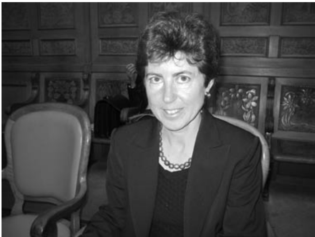
Kathy Riklin engagiert sich im Parlament für eine aktive Bildungspolitik.