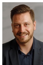
Autor: Benjamin Hospenthal

Bachelor of Science in Wirtschaftsingenieurwesen